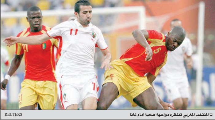
ك المنتخب المغربي تنتظره مواجهة صعبة أمام غانا

بالبفون على الكونغو -1 صفر وتعادل أمام تونس صفر-صفر في الثانية وكان بحاجة إلى التعادل فقط في المباراة الأخيرة أمام نيجيريا المصنفة، وقال «نحتاج 2 وودع البطولة. واعتبر هنري ميشال بصعوبة حزن بطاقة التأهل، وقال «نحتاج إلى إنجاز استثنائي أمام غانا، إنه أمر صعب التحقيق لكنه الخيار الوحيد أمامنا إذا أردنا مواصلة المشوار في البطولة». وتابع «نحن السبب في هذا الوضع، فبعدما كنا في موضع قوة بفوزنا الكبير على ناميبيا 5-1، أصبحنا الآن في موقع ضعف ومصيرنا يتوقف على نتيجتي مباراتنا مع غانا، وغينيا مع ناميبيا». وأوضح «قدمنا الفوز هدية للمنتخب الغيني، ارتكبنا أخطاء قاتلة ودفعنا ثمنها في الملعب، لم نقدم عرضا جيدا ورفضنا لضغط الغينيين كنا الأقرب إلى التسجيل عندما وقعت غينيا هدفها الأول من ركلة حرة مباشرة، وضغطنا بعد ذلك بحثاً عن التعادل فاستقبلت شباكتنا هدفاً ثانياً، وجاءت ركلة الجزاء التي سجل منها الهدف الثالث». وأضاف «كل ما علينا فعله الآن